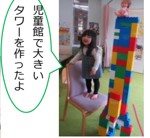
児童館で大きいタワーを作ったよ