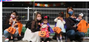
~ハロウィン~ 仮装して、バッグを作って、トリックオア トリート!!