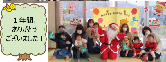
1年間、ありがとうございました!