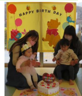
~クリスマス誕生日会~