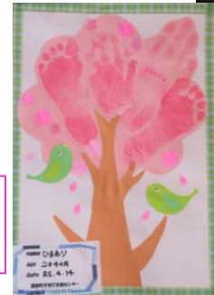
ベッタンアート 桜の木