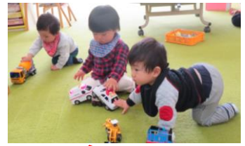
車のおもちゃって楽しいよね♪